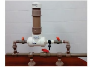
Dosador artesanal de cloro em pastilha