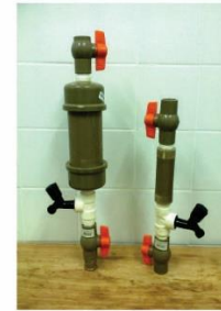
Dosador artesanal de cloro granulado

Além da Salta-z, a FUNASA também desenvolveu dosadores artesanais de cloro (granulado ou em pastilha) e de sulfato de alumínio, para desinfecção da água e remoção de turbidez.