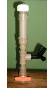
Dosador artesanal de sulfato de alumínio